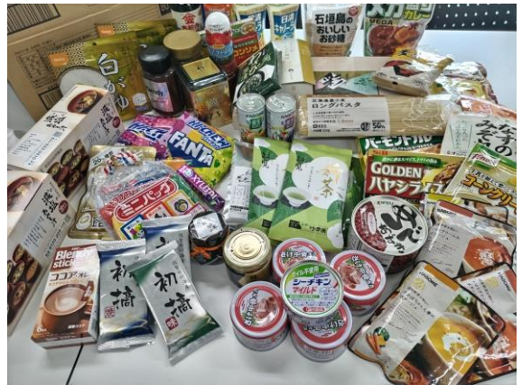
寄付された食品の一例→

配布先は今日食べるものもなく困っている方です。まずは食べて元気になってもらい、普通の生活に戻るためにはどうすればよいか、考えていきます。支分に喜ばれる食品は、料理の必要なくすぐに食べることができるレトルト・缶詰などです。子ども1人でも食べられるため、喜ばれます。